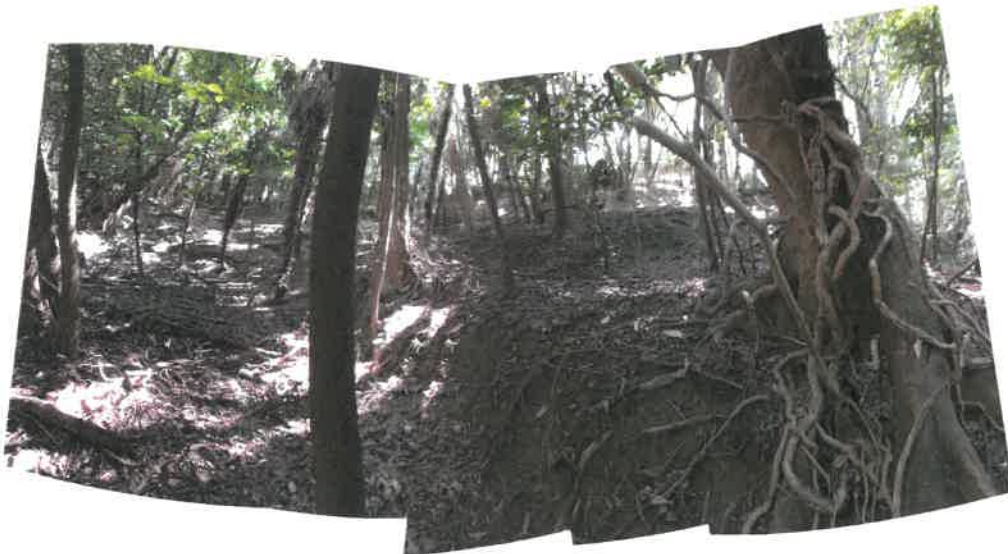
北西側から南東方向の状況