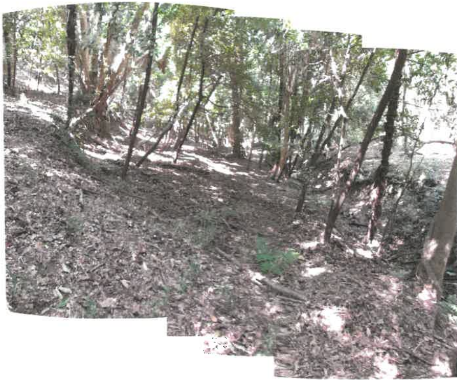
東端付近から西方向の状況