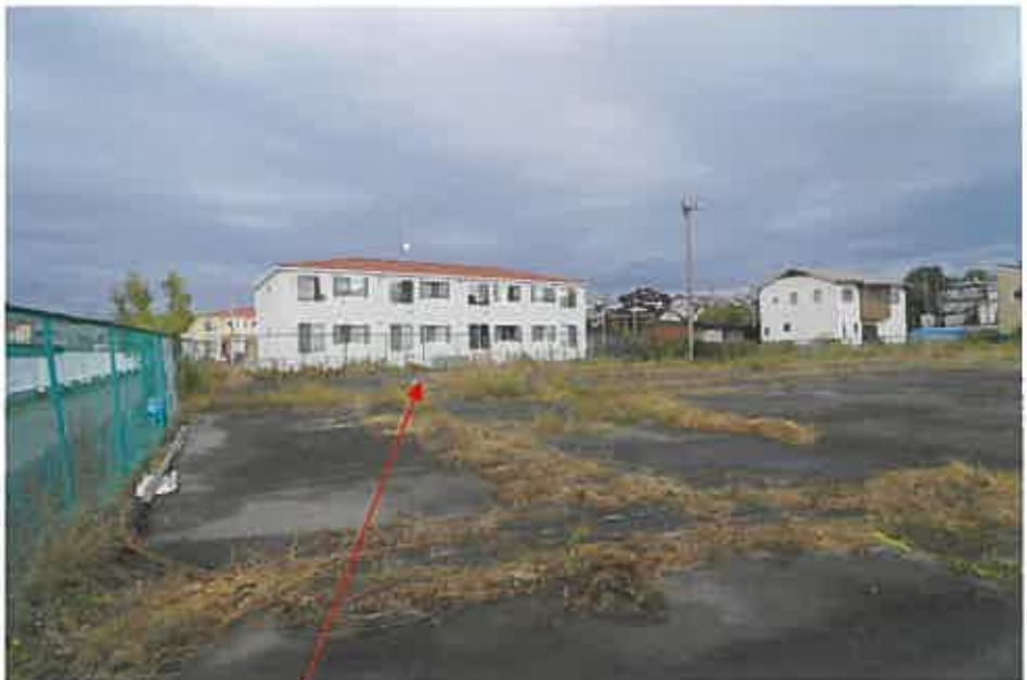
物件 3、8 土地