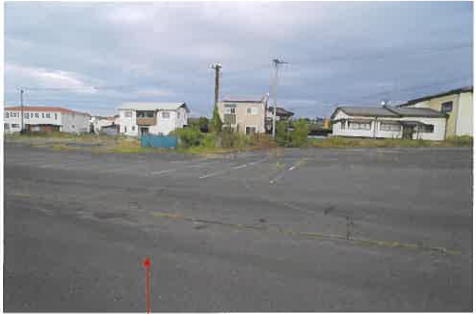
物件 1、2、5、8 土地