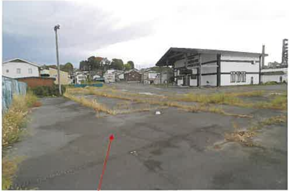
物件 2、5、8 土地