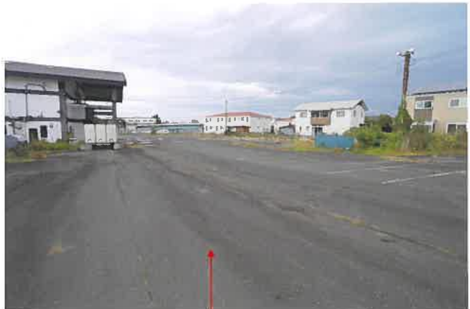
物件 1、2、3、5、8 土地