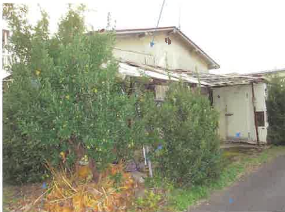
201番1土地 物件1 プレハブ冷蔵庫(動産) 市道 No. 2