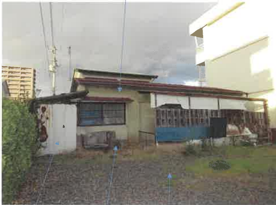
プレハブ冷蔵庫(動産) 物件1 203番1土地 No. 1