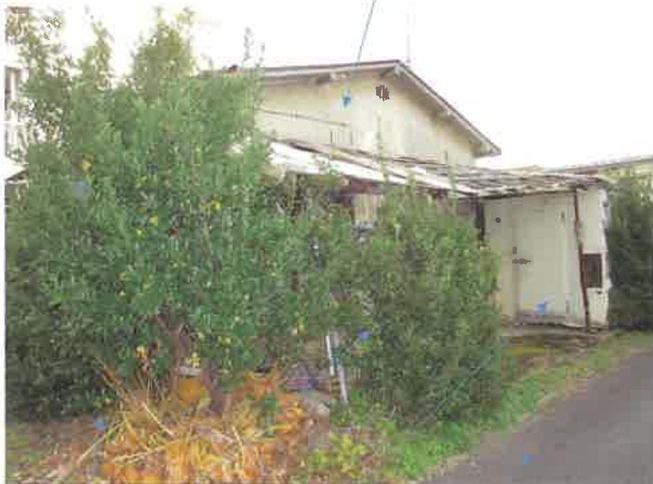
201番1土地 物件1 プレハブ冷蔵庫(動産) 市道 No. 2