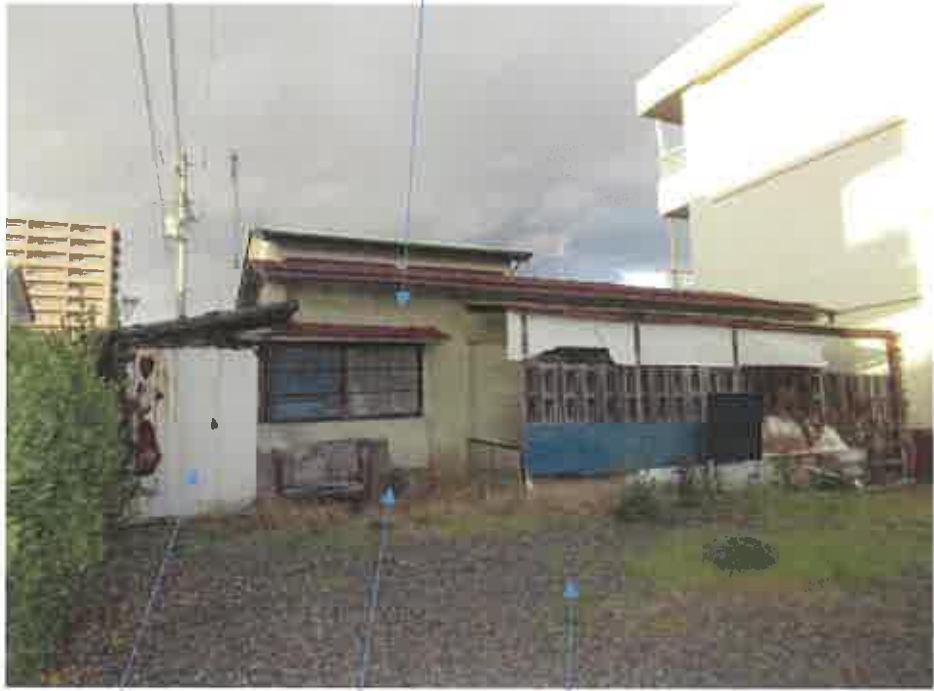
プレハブ冷蔵庫(動産) 物件1 203番1土地 No. 1