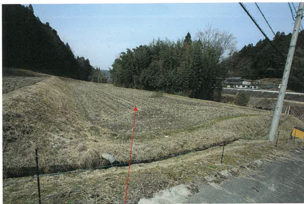
物件 1 3 土地